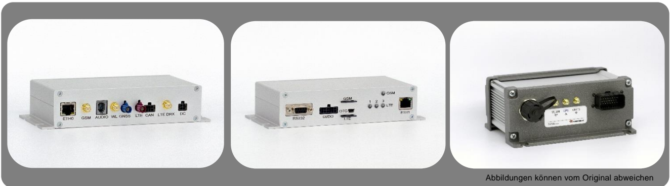
Abbildungen können vom Original abweichen