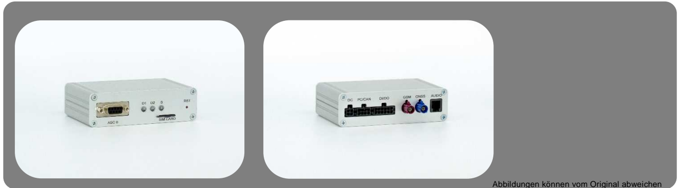
Abbildungen können vom Original abweichen